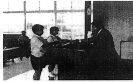
【図画作品展賞状授与】