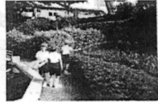
(朝のボランティア活動)

子どもたちの1学期の様子はいかがだったでしょうか。「おはようございます」と元気な声であいさつをしながら朝早く登校し、朝のかけ足やボランティア活動にも意欲的に取り組む子どもが増え、作品展やスポーツ大会などでもいい結果を出すことができました。