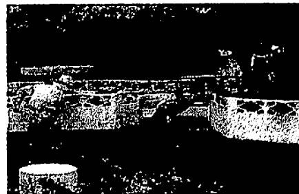
【八光池もきれいに】

8月23日(日)に実施されましたPTA愛校作業(幼稚園・小学校合同)には、多くの保護者の参加をいただき、猛暑の中、「校庭の除草、草払い」「樹木の剪定・伐採」「八光池の清掃」等の作業をしていただきました。幼稚園や学校全体が大変美しくなり、教室も明るくなりました。重機・車両・機材等たくさん提供していただき大変助かりました。ありがとうございました。