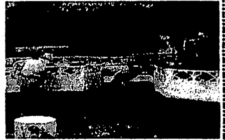
【八光池もきれいに】

8月23日(日)に実施されましたPTA愛校作業(幼稚園・小学校合同)には、多くの保護者の参加をいただき、猛暑の中、「校庭の除草、草払い」「樹木の剪定・伐採」「八光池の清掃」等の作業をしていただきました。幼稚園や学校全体が大変美しくなり、教室も明るくなりました。重機・車両・機材等たくさん提供していただき大変助かりました。ありがとうございました。