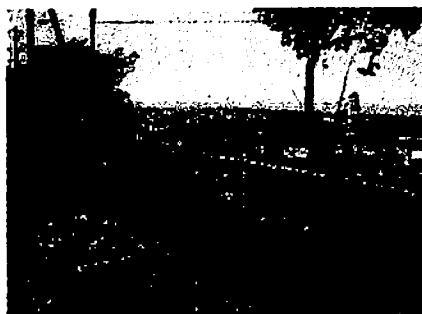
【海が見えるようになってすっきり】